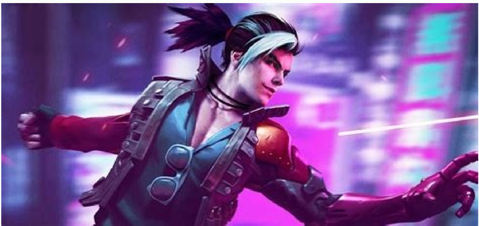
Aplikasi android untuk hack wifi tanpa root. Aplikasi hack game untuk android tanpa root.